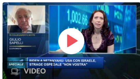
Biden a Tel Aviv, quali scenari?