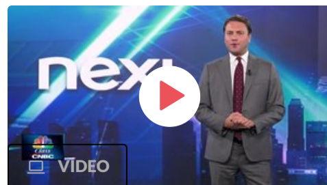
Nexi, rumors di opa