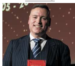
Daniele Rutigliano Serravalle Designer Outlet