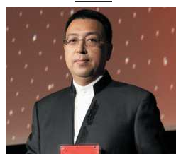
Luo Zhiwei Shanghai Promotion Center