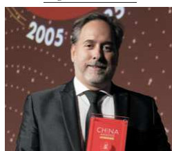
Daniele Rutigliano Serravalle Designer Outlet