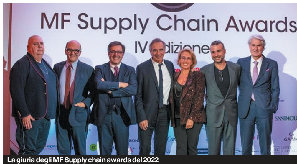
La giuria degli MF Supply chain awards del 2022