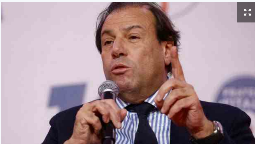
Il viceministro dell'Economia Maurizio Leo

Razionalizzazione dei tributi, semplificazione del sistema sanzionatorio, tre aliquote Irpef. La delega fiscale prende forma. Il dossier è già sul tavolo del governo, che spinge sull'acceleratore per portare la riforma in Consiglio dei ministri tra poco più di un mese. Tramonta invece l'ipotesi di mettere mano al nodo del catasto. A fare il punto sul cantiere del fisco è il viceministro dell'Economia Maurizio Leo, che dopo il lavoro sulla tregua fiscale in manovra, ora è concentrato sulla delega.